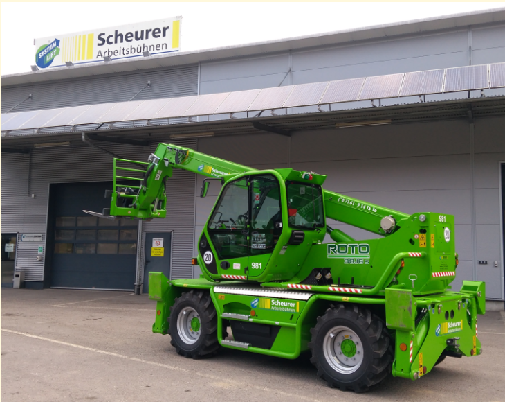
MASCHINE AUF ABSTÜTZUNGEN

Vermietung | Verkauf | Service Partner der System Lift AG